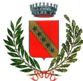
Comune di Remanzacco