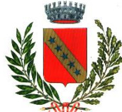
Comune di Remanzacco