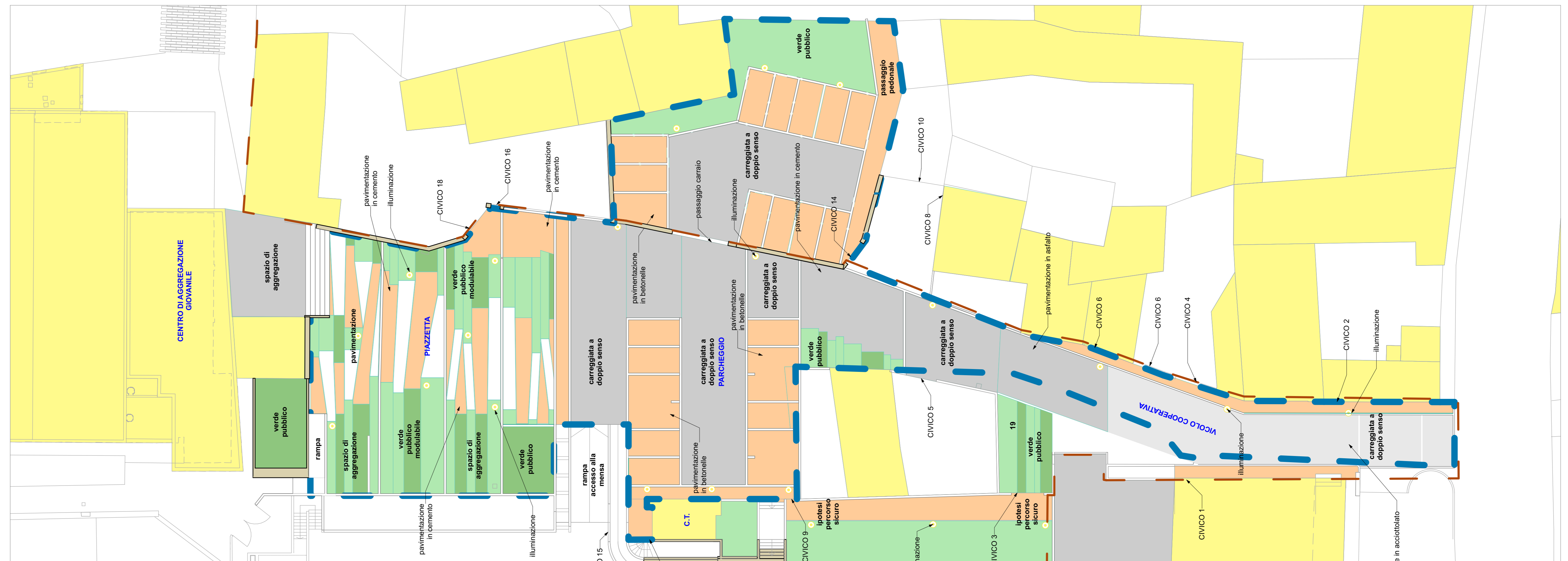
STATO DI PROGETTO (planimetria)

REGIONE FRIULI VENEZIA GIULIA PROVINCIA UDINE COMUNE DI REMANZACCO Piazza Paolo Diacono, 16 33047 Remanzacco (Udine) tel. 0432 / 667013 P.I. 00298690306 C.F. 80006810305 Responsabile area per il Comune: Flavia Rinaldi Unità area operativa lavori pubblici: Francesca Candido strada: Vicolo cooperativa foglio: 13 mappale egg.: 2184 - 326 - 1944 - 330 - 300 oggetto: PROGETTO DI FATTIBILITA' TECNICA ED ECONOMICA Vicolo Cooperativa e Piazzetta di accesso 1) alla scuola primaria; 2) al Centro di Aggregazione Giovanile; 3) alla scuola dell'infanzia; 4) alle Mense. progettista: Andrea Martini ELABORATO: STATO DI PROGETTO (plan.) TAV. 04 tipologia materiali viste tematiche FILE: DOC:\PR\FR\FV\REMANZACCO\COOPERATIVA SCALA: DATA: 22 / 02 / 2018 REDDATO: arch. Andrea Martini Uff.preposti: arch. Andrea Martini APPROVATO: arch. Andrea Martini AUTORIZZATO: arch. Andrea Martini RUP: Revisione: Data: il progettista: Studio di Architettura: arch. Andrea Martini via PICCO N. 12 33047 REMANZACCO UD p.i. 022836690300 e-mail: arch.martini@alice.it cell: +39 333 99 36 861