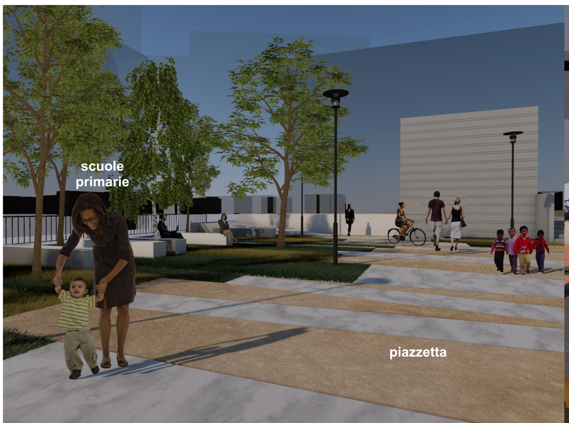
STATO DI PROGETTO (vista dall'alto)